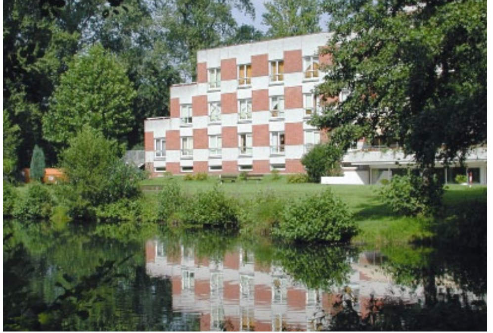
HAUS TOGOHOF Alten- und Pflegeheim